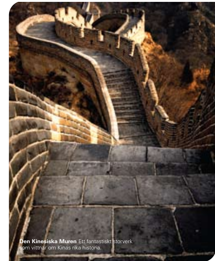
Den Kinesiska Muren Ett fantastiskt storverk som vittnar om Kinas rika historia.

Ny levnadsstandard leder till bättre tandhygien. Ökad inkomst och dålig munhygien leder till en ökad inhemsk efterfrågan av tandvård: Snittinkomsten i Peking har sedan år 2000 fördubblats, och 97 % av alla kineser anses vara i behov av dentala restaurationer. Urbaniseringen ökar tillgängligheten till tandvård för patienten samt ökar kundbasen för de stora laboratorierna, vilket leder till lägre priser och möjligheten för laboratorierna att göra fortsatta investeringar.