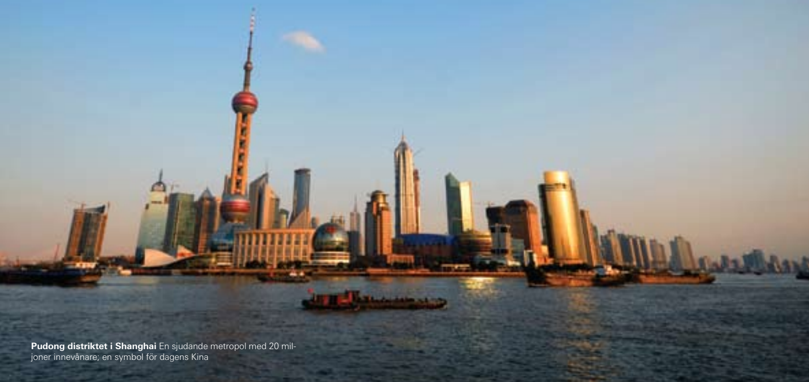
Pudong distriktet i Shanghai En sjudande metropol med 20 miljoner innevånare; en symbol för dagens Kina