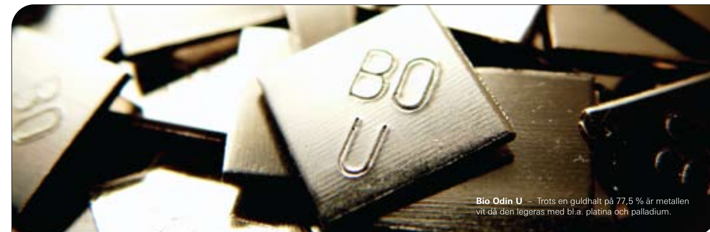
Bio Odin U – Trots en guldhalt på 77,5% är metallen vit då den legeras med bl.a. platina och palladium.